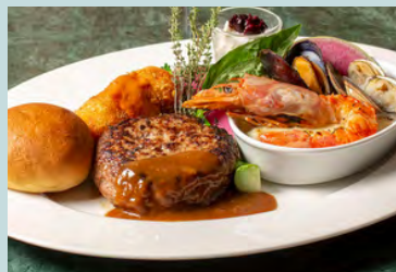
blue terminalコンボプレート -ハンバーグ&シーフードドリア 蟹クリームコロッケ、ミニデザート