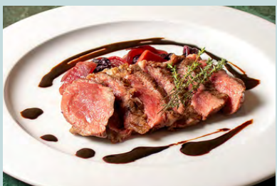
Beef tagliata steak w/ agrodolce 2400