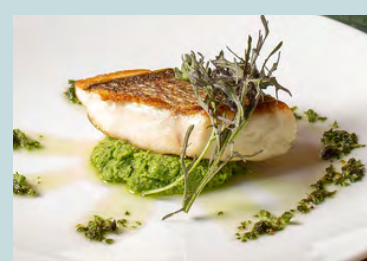
Sea bream grill w/broccoli pure, shiso 1800