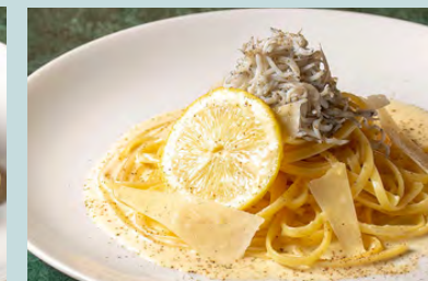
しらすとパルミジャーノの レモンカルボナーラ