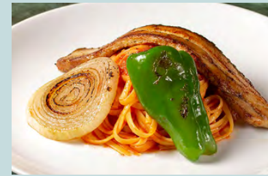
Yokohama napolitan 1600