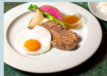
Roast pork & egg plate w/honey mustard 1700