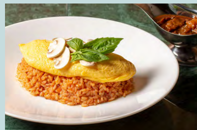
Fresh mushroom hashed beef omelette rice 1700