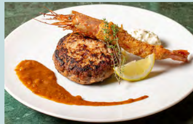
Hamburg steak & deep fried prawn w/miso mustard demi glace 2000