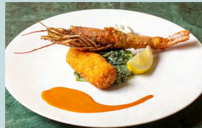
Deep fried prawn & crab cream curoquette w/dashi aurora source 1800