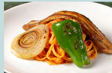
自家製ベーコンの 横濱ナポリタン