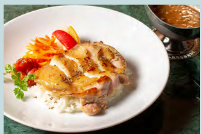
カレーライス w/ 醤油麹柚子チキンのグリル