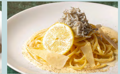
Whitebait & lemon carbonar 1600