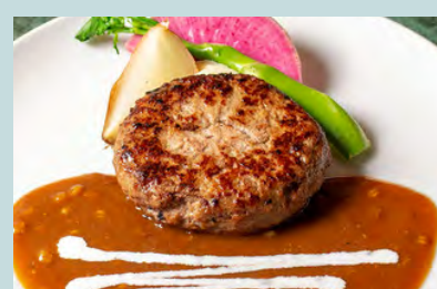
Hamburg steak w/miso mustard demi glace 1800