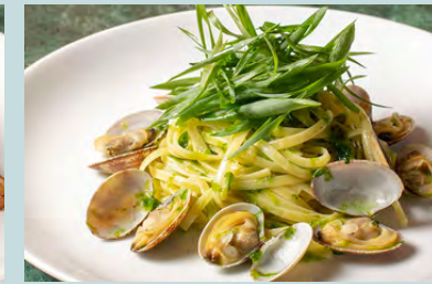
Kujo-negi & nori vongole verde 1500