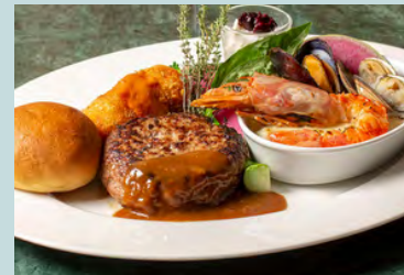
blue terminal combo plate -Hamburg, seafood dria ,bread crab cream croquette, dessert 2700