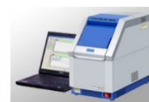
イノベティブPCR検査法