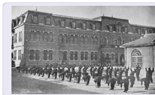
浅草(蔵前)にあった校舎前 徒手体操をする生徒たち

入学し 科学技術の世界の入口に立つ 情熱はあるが 教科書はない 道案内役である先生の話に耳を傾け 開拓者を目指す 聞いただけでは すぐ忘れる メモしても断片的にしか理解できない 文章にして初めて 真に理解できる ノートにまとめ 体系化する 蔵前の香りがする「教科書(Concept Map)」ができる 自分の理解が 眼下に広がる風景のように 見えてくる もう巣立ちの準備は十分だ 教科書に代わるノート作り その経験が蔵前人を作り その内容が 海図として 卒業後の大航海を支えた