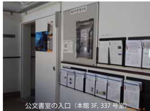
公文書室の入口 (本館 3F, 337 号室)

国立大学法人で作成される文書類は、「法人文書」として一定期間保存された後に、多くは廃棄されますが、歴史的文化的に重要なものは公文書室に移管され「特定歴史公文書等」となります。これらは広く一般に公開し、種々の角度から読み解いてもらうこととなりますが、公文書室としても独自の視点で読み解いていきます。これまでに「とっておきメモ帳」(No. 1~8)、「発掘！東工大の研究と社会貢献」(No. 1~4)、「今月の一枚」(2015年10月~)などを発行・掲示していますので、Web 頁あるいは百年記念館 1 階 (愛称: T-POT, 本館 3 階奥 (下図)) でご覧下さい。