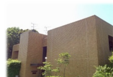
↑レンガの建物です