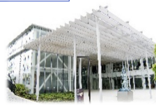
↑大岡山駅前の建物です