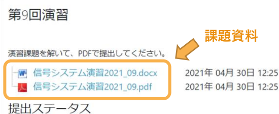
課題の画面上部に表示される課題の資料