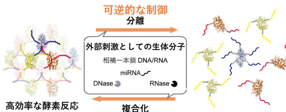
図1. DNAを介した酵素の可逆的な近接・分離制御

また、マイクロRNA(miRNA)と呼ばれる短いRNA鎖は特定の腫瘍細胞で異常発現することが知られており、がんの早期診断のためのバイオマーカーとして利用する応用研究が進んでいます。酵素同士をつなぐDNAに3種のmiRNAを認識する配列をもたせた酵素-DNA複合体を作製し、3種のmiRNA存在下では分離して酵素反応を抑制するシステムを構築しました。酵素近接状態の流体力学的直径は 236.0 \pm 11.31 nmであり、そこへ3種のmiRNAを加えると 33.5 \pm 2.76 nmに減少し、透過型電子顕微鏡による直接観察においても3種のmiRNA存在下で酵素-DNA複合体ネットワークが分離した様子が観察されました(図2)。さらに、近接状態から分離状態への形態変化で酵素カスケード反応の最終生成物量の減少がみられ、希薄なmiRNAを検出し、酵素反応を通して検出シグナルを増幅できることが示されました。