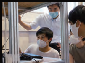
量子科学 Quantum science