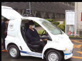
スマートモビリティ Smart mobility