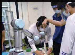
スマートロボティクス(ロボット・ランド) Smart robotics (Robot Land)