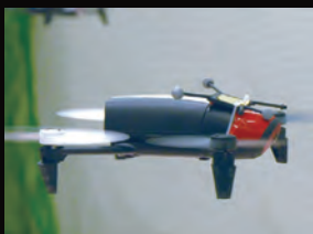
スマートロボティクス(ロボット・ズー・スカイ) Smart robotics (Robot Zoo Sky)