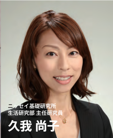
ニッセイ基礎研究所 生活研究部 主任研究員