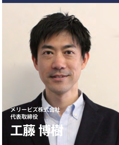
メリービス株式会社 代表取締役