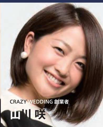
CRAZY WEDDING 創業者