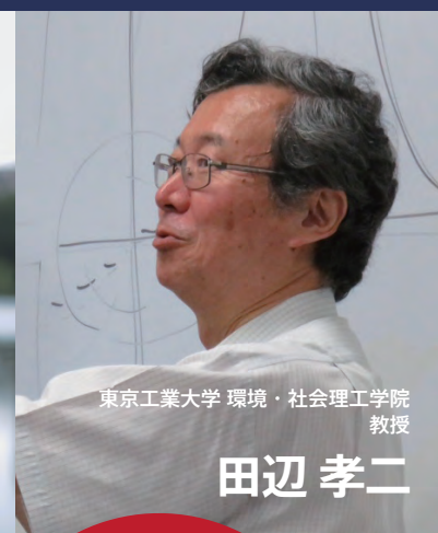
東京工業大学 環境・社会理工学院 教授