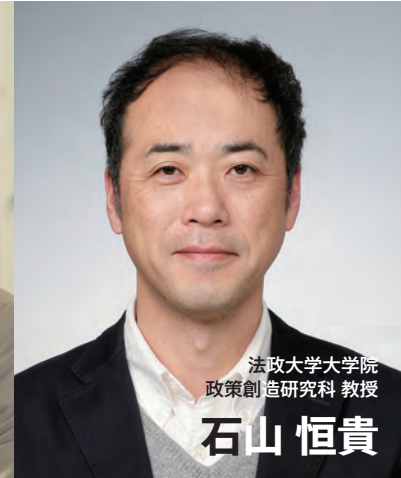
法政大学大学院 政策創造研究科 教授