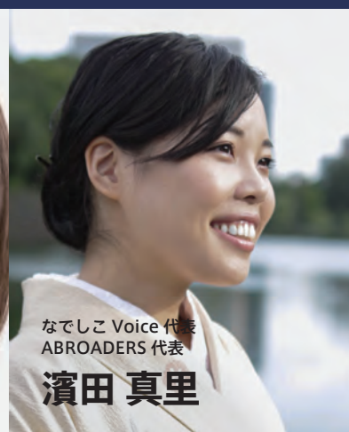
なでしこ Voice 代表 ABROADERS 代表