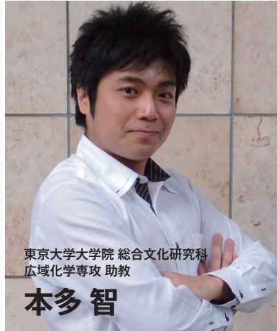
東京大学大学院 総合文化研究科 広域化学専攻 助教