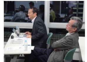
コーディネーターからのコメントの様子

JR山手線・京浜東北線田町駅より徒歩1分、都営三田線・浅草線三田駅より徒歩5分に立地する田町キャンパスで開催します。