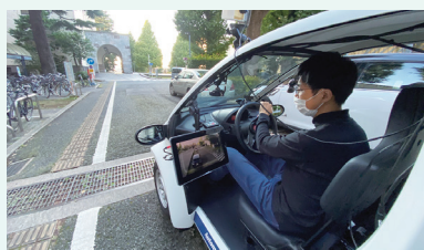
スマートモビリティ Smart mobility