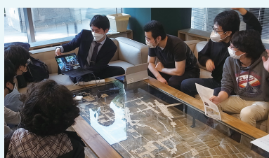
スマートワークスペース Smart workplaces