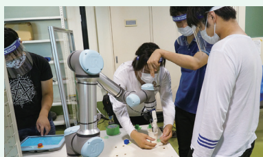
スマートロボティクス Smart robotics