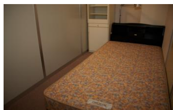
Double room(Two beds)