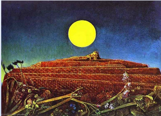
The Entire City Max Ernst (1891-1976)