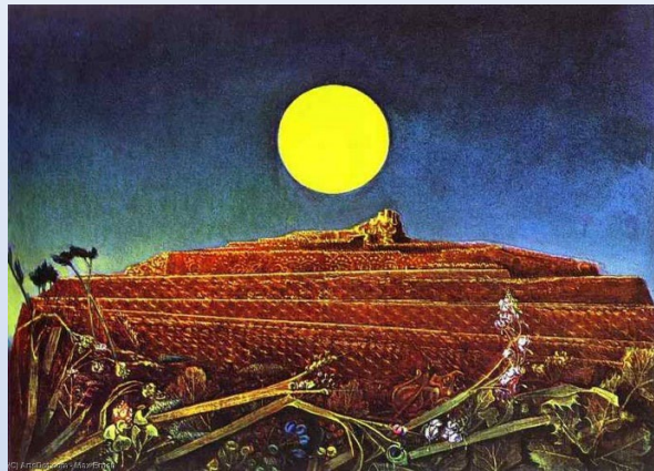
『都市の全景』より マックス・エルンスト (1891-1976)