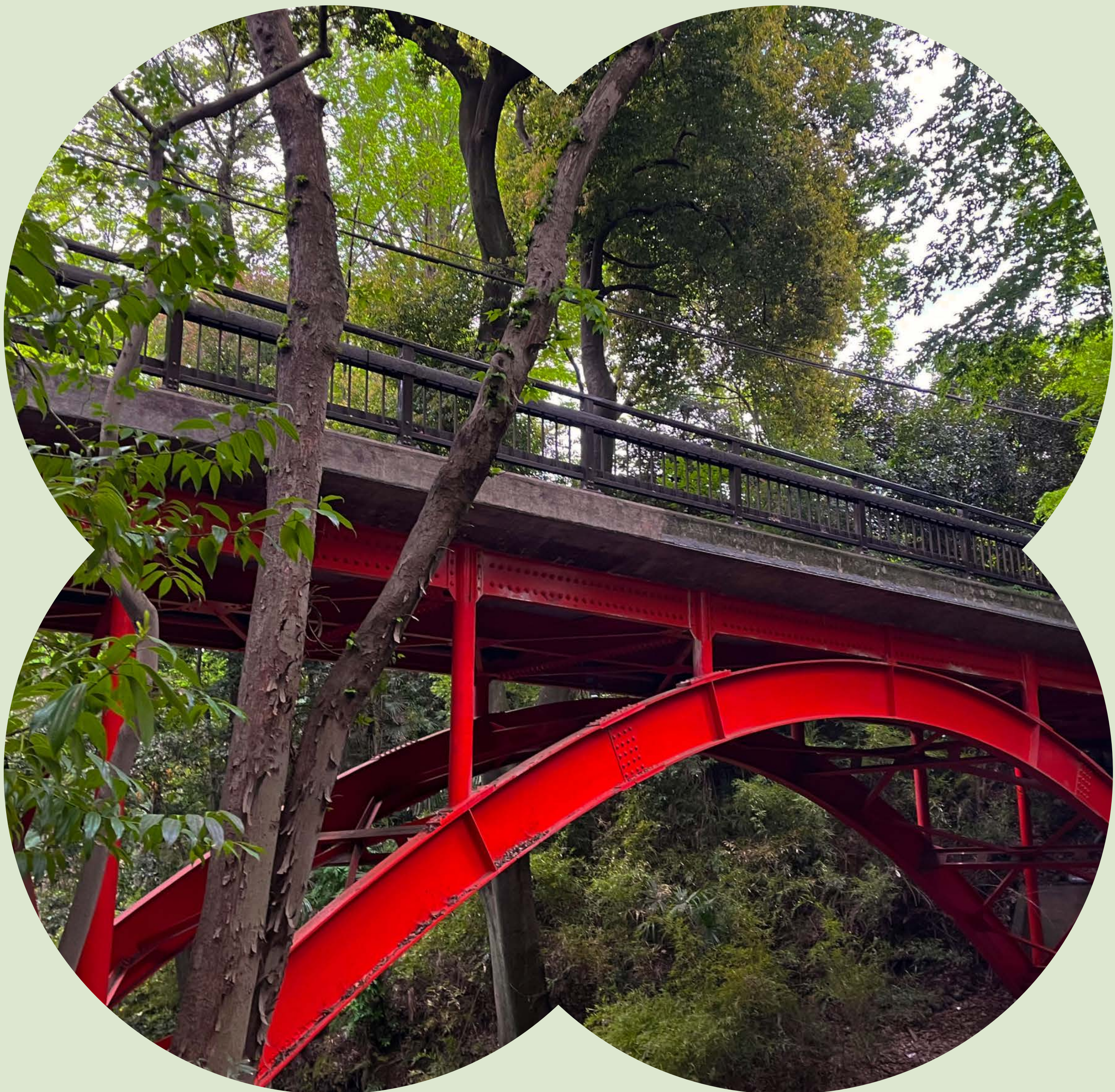
Golf Bridge (Todoroki Valley)