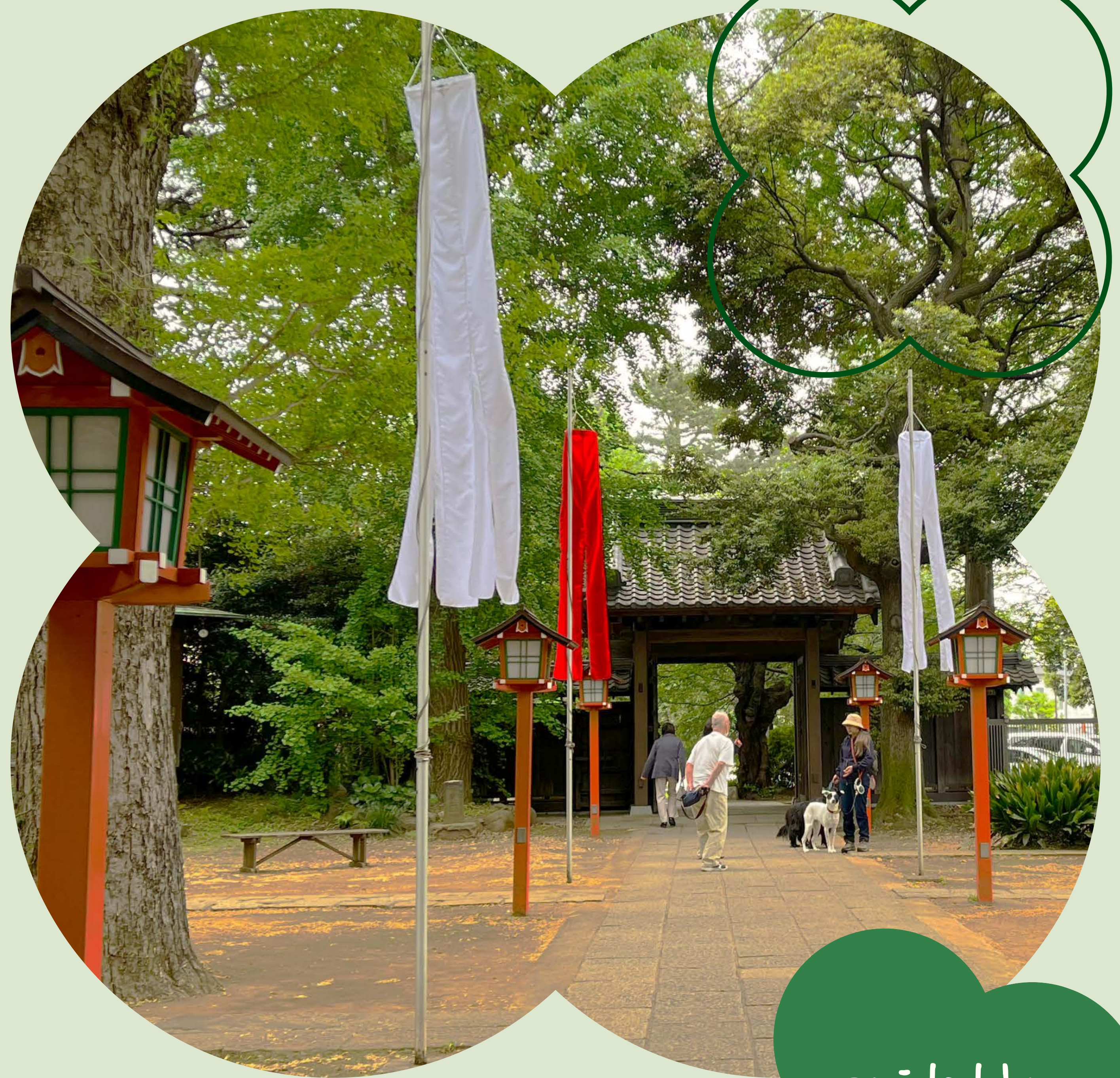
Todoroki Fudouson Temple

Let's enjoy learning about beautiful nature and Japanese culture!