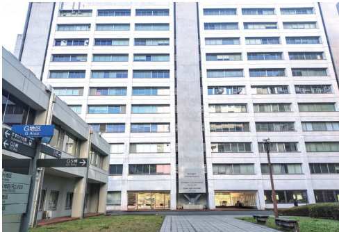
ここが横浜保健管理センターです Here is the Student Healthcare Center

横浜保健管理センター (G3 棟 2 階) Healthcare Center at Yokohama, G3 Bldg., Floor 2