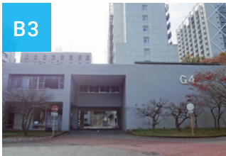
G 地区 G-Area