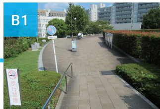
この分岐点を左へ進みます Go left of the fork