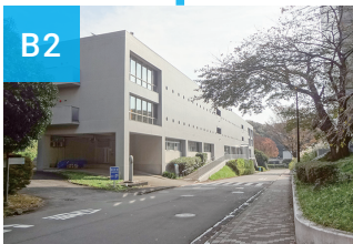
図書館 Suzukakedai library