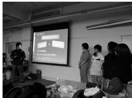
図4 創造性育成科目の例（構造力学実験（ブリッジコンペティション））