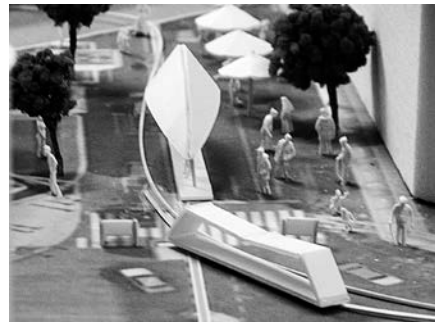
図2 創造性育成科目の例（インフラストラクチャーの計画と設計）