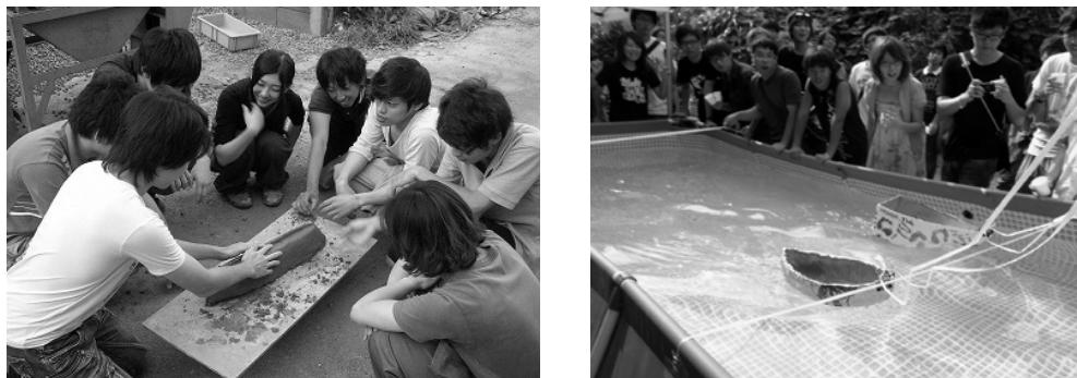
図5 創造性育成科目の例（コンクリート実験（ミニカヌーコンペティション））

ミニカヌーコンペティションでは、セメント材料を用いたミニカヌーを学生自身のアイディアで製作し（左写真）、プレゼンテーションやレース（右写真）等を行うことによって、その設計コンセプトや競漕力をチームで競い合っています。平成20年度からは台湾の国立中央大学も参加しており、学生が国際交流を深める機会にもなっています。