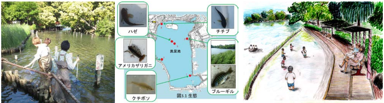
図3 創造性育成科目の例（環境計画演習）

地域の環境の現状や問題点を現地調査によって把握し、環境との共生・調和のあり方について具体的な提案をします。下の写真は「洗足池公園」を対象に、現地で水質、大気、生態の観測を行い、環境への諸影響を総合的に評価して、遊歩道や防砂林などの環境改善案を検討した時の写真、観測結果、提案イメージ図です。