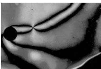
液晶の顕微鏡写真

本学科では、材料開発で指導的な役割を担うべきマテリアル・エンジニアや、有機材料工学分野の研究者・教育者の養成を目指し、材料科学、物理化学、有機化学、材料力学等の基礎科目群と、応用との接点を探るエンジニアリングサイエンス科目群を両輪とする教育プログラムにより、系統的な基礎および専門教育を推進しています。