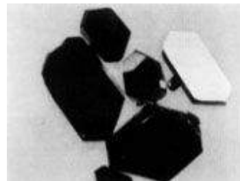
有機超伝導体の結晶