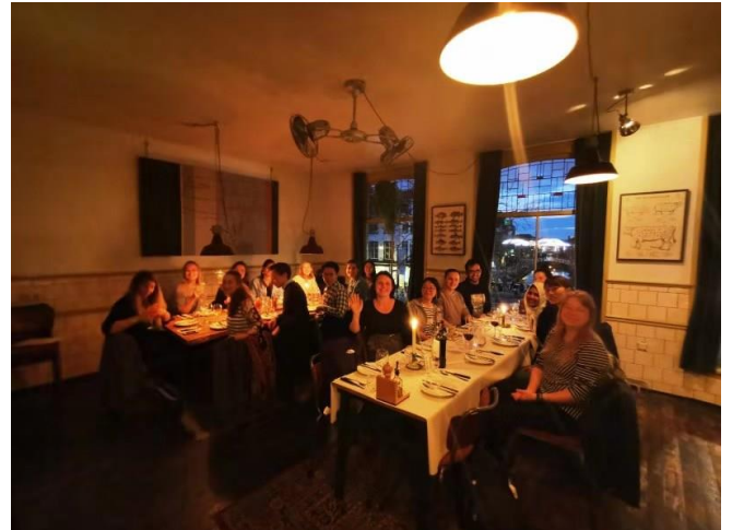
(左)Final presentation : DDW の展覧会に基づき、最新のテクノロジーから生じる倫理問題を予測し、解決策を考えた発表です。私のチームは牛糞を使った建築素材の工業化について発表を行いました。 (右)グループディナー：最終発表の前日にみんなでグループディナーをしました。