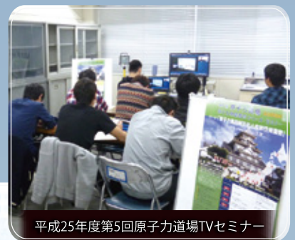
平成25年度第5回原子力道場TVセミナー

*この事業は文部科学省「平成26年度 原子力人材育成等推進事業費補助金」によって行われます。