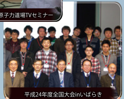
平成24年度全国大会inいばらき