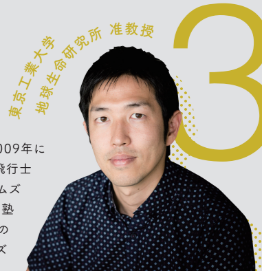
東京工業大学 地球生命研究所 准教授