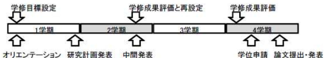
付図2 生体分子機能工学専攻修士課程における修士論文研究の流れ

修士論文研究では、一連の研究プロセスを体験し、問題設定能力、問題解決力やコミュニケーション力の向上を目指す。そのための修士論文研究の流れを付図2に示す。1学期終了時に研究計画の作成・発表、2学期後半に中間報告を行う。これらを経て、4学期末の論文提出・発表にいたる。