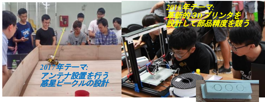
日台混成チームによるメカ試作とチーム間のコンテスト