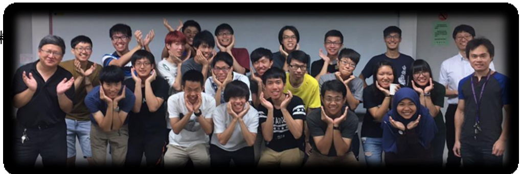
プロジェクト修了、全員で達成感溢れる集合写真