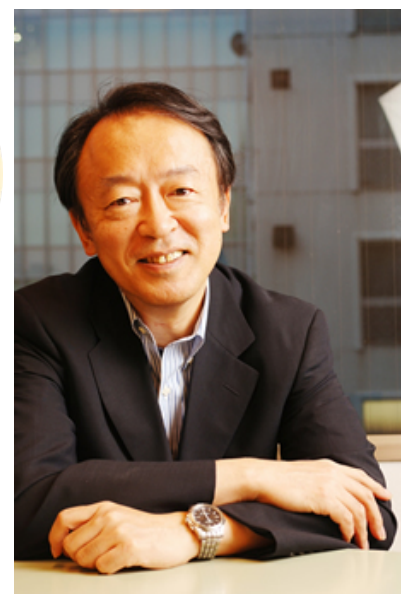
本学の池上彰教授が未来社会の夢を語ります