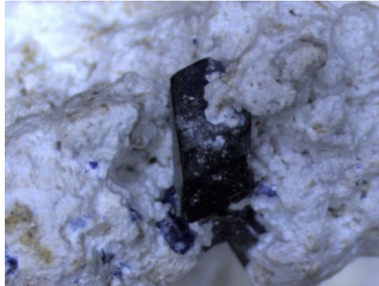
図 1：天然の逸見石結晶

この発見は、稀少さのために磁性研究の舞台に上がることが少なかった「日本産新鉱物」に注目するという、新しい視点を持った研究です。今後、日本産新鉱物の多様性に注目することで、驚くような物理現象の発見が期待されます。