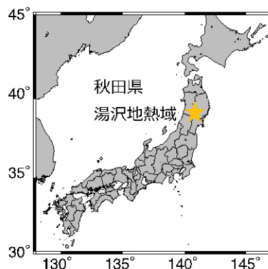
図 1. 研究対象地域である秋田県湯沢地熱域の位置（黄色い星）。

本研究グループは、超臨界地熱資源の有望地区である秋田県湯沢地域において、電磁探査を行い、超臨界地熱資源の分布の可視化を試みた（図 1）。自然に発生する電磁波を利用する電磁探査法は、地下を掘削することなく地下の 比抵抗 （用語 2）情報を取得できる。比抵抗は、物質の電気の流れやすさ・流れにくさを示す度合いを示すもので、超臨界地熱流体を含む岩石は、乾燥した岩石に比べて低い比抵抗を示す傾向にある。