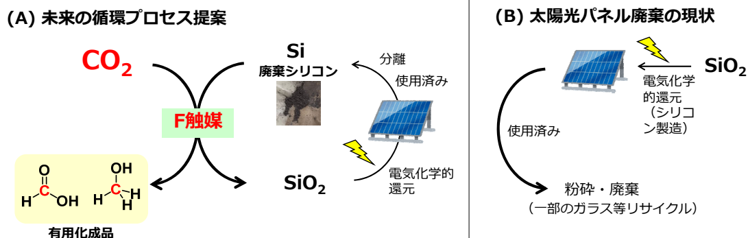
図 4. (A) 提案する未来の資源循環プロセスと、(B) 太陽光パネル廃棄の現状

太陽光パネル問題の両者を一気に解決する新たな触媒反応として、本研究成果を展開します。