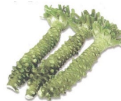
図 1. ワサビ品種 「真妻」の根茎

本研究成果は、日本時間 2023 年 7 月 11 日に Nature 姉妹誌 Scientific Data のオンライン版で発表されました。