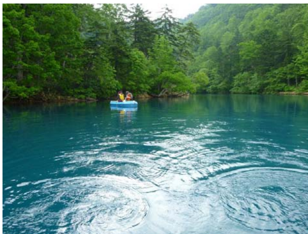
図1. 本研究を実施したオコタンペ湖の様子。一般の立ち入りは禁止されており、調査は環境省並びに森林管理署の許可を得て行っている。