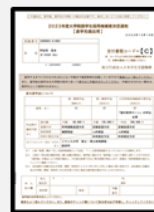
採用候補者決定通知【進学先提出用】

大学には1枚目のみ提出。裏面も記入を忘れずに。2枚目は本人保管用なので提出しないでください。(大学院課程は茶色の紙)