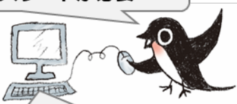
JASSOページ (スカラネット)