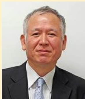
赤木 泰文 名誉教授・特任教授 Akagi, Hirofumi