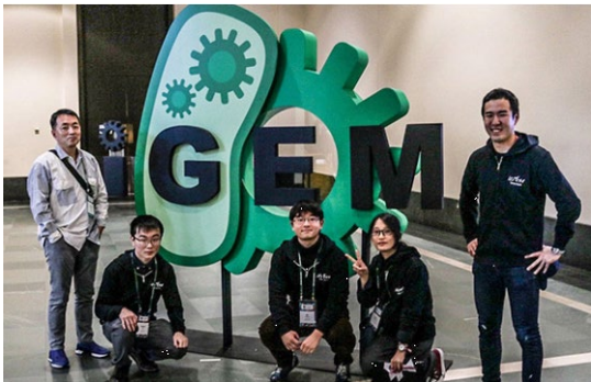
iGEM (The International Genetically Engineered Machine Competition) 世界大会参加