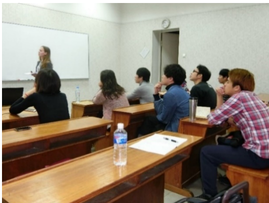
海外でのワークショップ