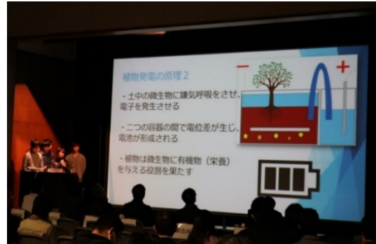
バイオものコン(先端バイオものづくり)