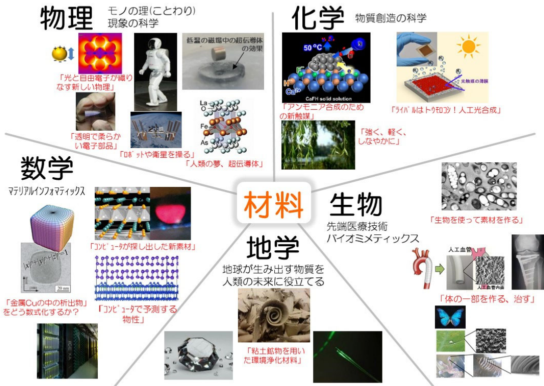
図1 材料は様々な基礎学術を元に幅広く展開され、社会の至る所で活躍している

日本の材料研究と産業は世界を牽引しています。材料系では、未来を担う君たち若い世代に対して、材料に関する高度な専門知識を提供し、独創的かつ挑戦的な研究・開発を推進できる素養を身に付けるための学修機会やシステムを用意しています。材料に関する諸問題は複雑かつ多岐に渡っていますが、これらの問題を自分自身で整理し、チャレンジし、答えを導き出す『創造力』、見出した答えから「新しいもの」を作り上げる『創成力』を身につけ、真の『独創性』を養ってくれることを期待しています。