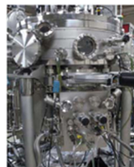
図3-3 高真空薄膜作成装置

無機材料分野の研究開発の大切なミッションは、周期表のあらゆる元素を組合せ、人々の生活や地球環境に優しい卓越した物性を持つ新物質を生み出し、その科学とそれを世に送り出すため技術を創り出すことです。それを実現できる人を育てるために「構造科学群」「物性科学群」「反応科学群」「プロセス科学群」の4つを柱とする教育体系が用意されています。これを通して、無機材料科学について系統的に学び、世界最高水準の知識を学習することができます。加えて材料科学者として大切な実験科目も、最先端の無機材料を間近に手にしながら、その本質を理解するまでじっくりと取り組める内容となっています。無機材料分野に進む学生には、海外の大学での研究やワークショップに参加する意欲が高い人が多く、互いに高め合い切磋琢磨する気風が息づいており、教員もこれを強くバックアップしています。無機材料分野を主テーマとしている研究室は対象物質や機能の面でとてもバラエティに富んでおり、学士課程を終えた学生はさらに修士、博士課程へと進学し、自分の関心のある分野の研究に邁進しています。