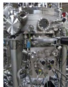
図3-3 高真空薄膜作製装置

無機材料分野の研究開発の大切なミッションは、周期表のあらゆる元素を組合せ、人々の生活や地球環境に優しい卓越した物性を持つ新物質を生み出し、その科学とそれを世に送り出すための技術を創り出すことです。それを実現できる人材を育てるために「構造科学群」「物性科学群」「反応科学群」「プロセス科学群」の4つを柱とする教育体系が用意されています。加えて、データサイエンスに関する科目の準備も進めています。これらを通して、無機材料科学について系統的に学び、世界最高水準の知識を学習することができます。加えて材料科学者として大切な実験科目