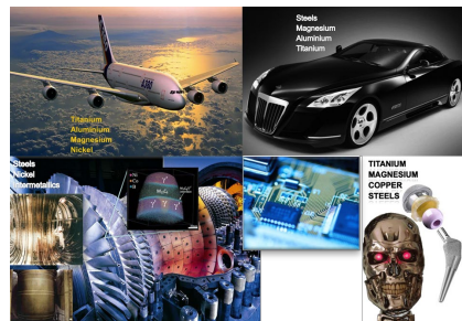
図3-1 金属の多様な用途

金属分野では、金属工学に関する科目を基礎科目から応用科目へと順次、学修できるようにカリキュラムが体系化されています。特に最近では、金属工学を学んだ学生の活躍分野が素材産業から全産業分野へと広がっていることから、金属工学のみならず、材料全般の基礎的科目の実力をつけることに重点をおいています。材料系の中の金属科目群は、さらに「金属の物理学」「金属の化学」「金属の材料学」に分類され、1年次の理工系基礎科目や2年次の材料系共通科目の学修内容を活かして、最先端の研究領域にまで学びを進められるように工夫されています。また、「グローバル理工人」の養成にも積極的に取り組んでいます。たとえば、3年次には専門知識を深めるとともに英語力を高めるために「金属工学英語