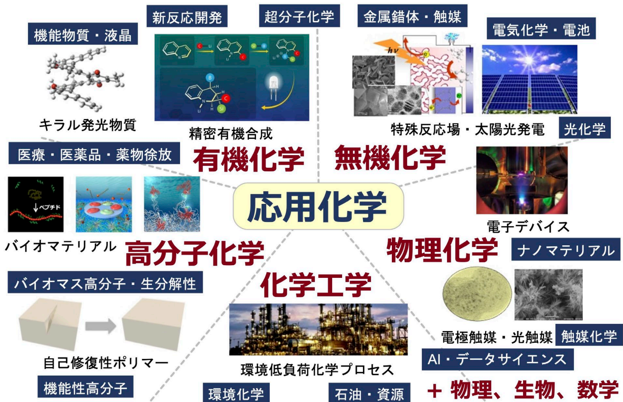
(図1) 応用化学の5つの専門科目群と研究のひろがり

『応用化学』は私たちの社会基盤・生活を支える重要な学問分野です。私たちの生活は、衣類、日用雑貨、医薬品からガソリンなどの燃料まで、様々な化学製品に囲まれています。これら化学製品の開発・生産は、物質変換の原理の解明と化合物の創成、機能と物性の発現メカニズムの解明、社会や生活に役立つ製品やシステムの構築・設計を研究対象としている『応用化学』が支えてきました。これからの社会の発展にも『応用化学』の知見が必要不可欠です。応用化学系は、技術革新に果敢に挑戦し、持続的な社会の構築に貢献する科学技術者・研究者を養成します。