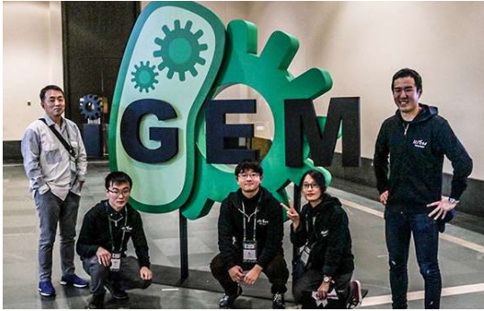
iGEM (The International Genetically Engineered Machine Competition) 世界大会参加