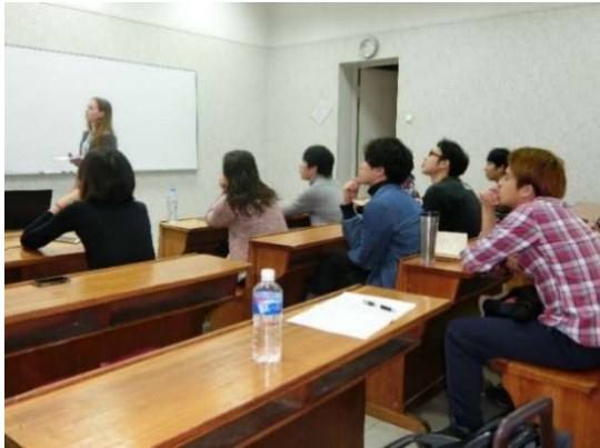
海外でのワークショップ