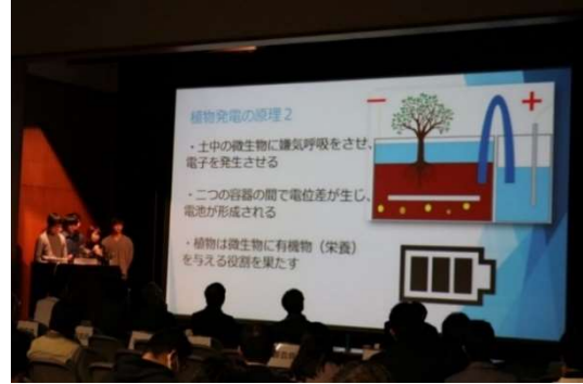
バイオものコン（先端バイオものづくり）