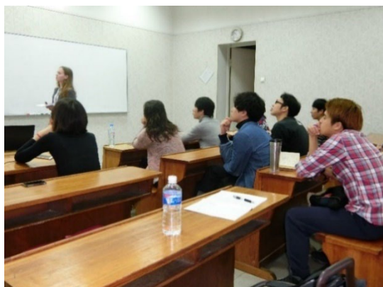
海外でのワークショップ