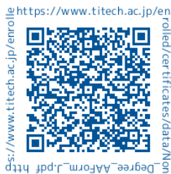
科目等履修生入学願書