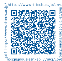
科目等履修生・学生証申請書