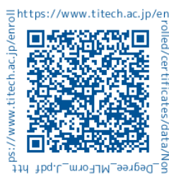
科目等履修生・理由書