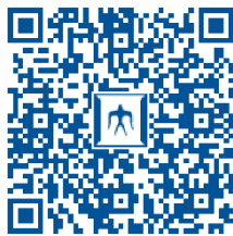
科目等履修生入学願書