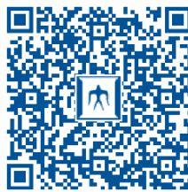
科目等履修生・理由書