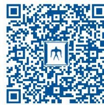
科目等履修生・学生証申請書