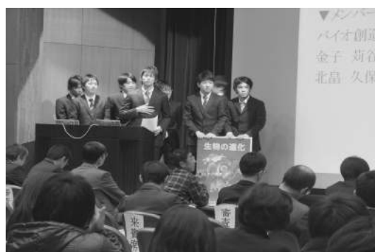
バイオコン参加(3年次)