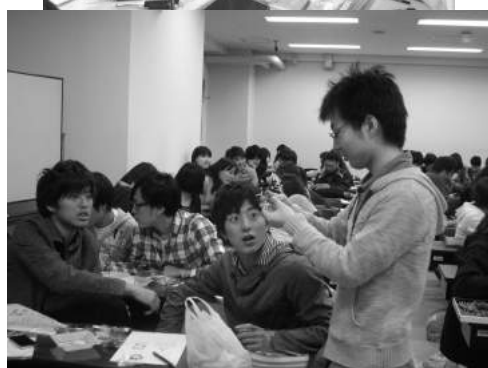
学生実習、演習(2年・3年次)