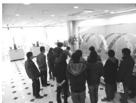
工場、企業研究所見学(3年次)