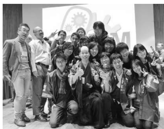
iGEM 国際大会参加(3年次)