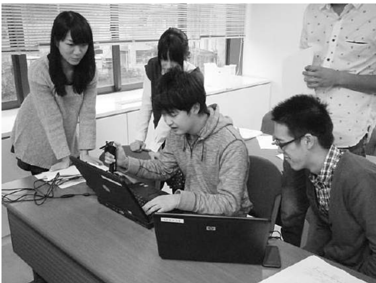
経営システム工学科の授業はグループワークが多いのも特徴

経営システム工学科は、高い数理能力と社会的関心を持ち、それを活かして21世紀の生産活動、企業活動、社会活動が直面する諸課題を解決しようという意欲あふれる学生を待っています。