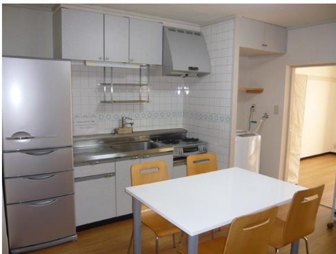
ダイニングキッチン (共通)