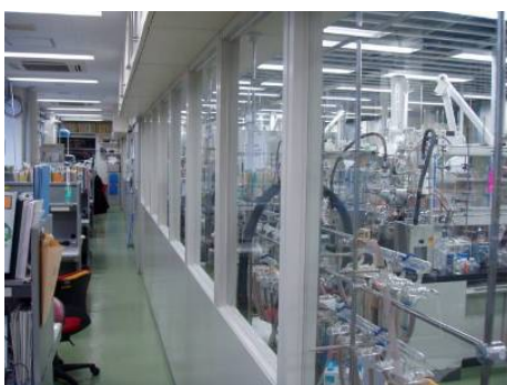
日本最高レベルの安全対策を施した 新鋭実験室（東1号館）

化学系の大きな特徴として、学生が安心して実験できるように実験室の安全対策を徹底していること、および周辺の環境への対策に努力していることが挙げられます。世界レベルの教員陣と研究設備を有する化学系に、熱意あふれる学生の皆さんが積極的に参加してくれることを期待しています。