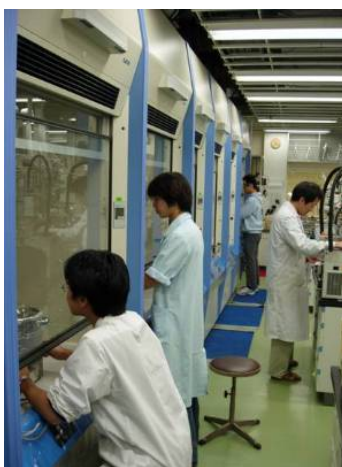
整備された合成実験室