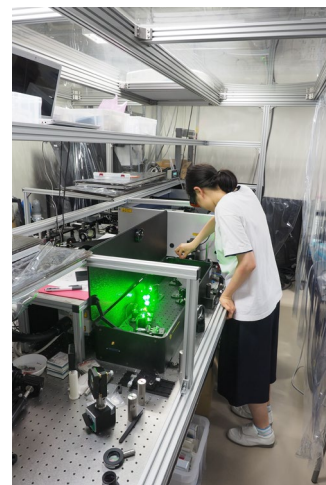
最先端のレーザー計測器